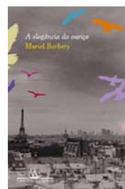
A Elegância do Ouriço – Muriel Barbery