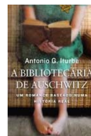
A bibliotecária de Auschwitz Antonio G. Iturbe